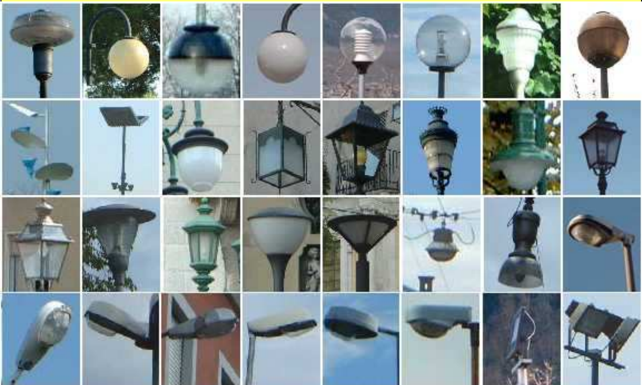
Figura (sopra) Esempi di corpi illuminanti obsoleti ed inquinanti non rispondenti ai criteri indicati dal presente regolamento. Non utilizzare questi prodotti per nuove installazioni

c) Anche in questo caso é preferibile utilizzare corpi illuminanti cut-off, e, in ogni caso, non dobbiamo superare i limiti di emissione massima previsto per tali genere di ottiche. E' comunque, sempre, preferibile utilizzare corpi illuminanti con lampade completamente incassate, in modo da limitare la dispersione di luce e limitare l'impatto visivo.