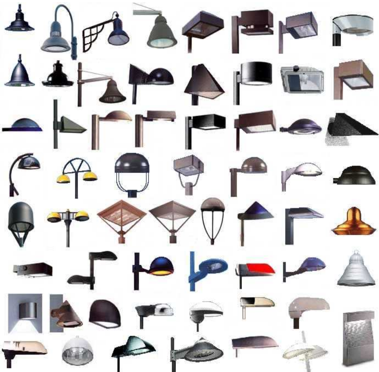
figura (sopra) Esempi di prodotti cut-off da utilizzare per l'illuminazione di strade, parcheggi, zone residenziali, ecc.