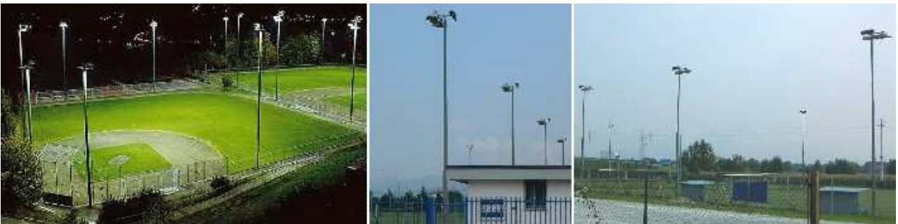
Figura (sopra) Esempi di corretta illuminazione di impianti sportivi

d)Ad esempio, nel caso specifico degli impianti sportivi, in molti casi può essere determinante al fine di contenere l'inquinamento luminoso e l'abbagliamento rivedere l'inclinazione dei proiettori in modo da assicurare livelli di emissione massima in linea con quanto previsto per l'illuminazione di grandi aree; inoltre possono essere installati nella parte superiore dei proiettori appositi schermi metallici atti a contenere la dispersione verso l'alto.