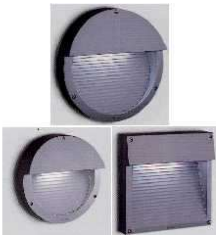
Figura (sotto) ottimi apparecchi completamente schermati da utilizzare per percorsi interni, segna passo ed illuminazione residenziale in genere

Gli impianti esistenti, non conformi a tali caratteristiche tecniche e non rientranti nelle deroghe sopra descritte si adeguano con procedure anche a basso costo alle indicazioni tecniche riferite per detto genere di ottica. Dopo la procedura di adeguamento la dispersione massima non può essere superiore al 3% come stabilito dall'allegato A della L.R. 39/2005.